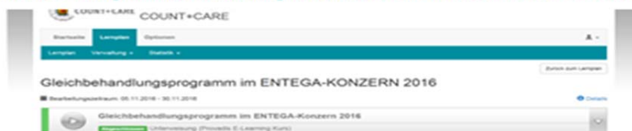
Abb.: Nachweis der Einhaltung des Schulungsintervalls zum Gleichbehandlungsprogramm

2. Die Schulung zur Gleichbehandlung im Jahr 2016 fand vom 05.11.-30.11.2016 statt.