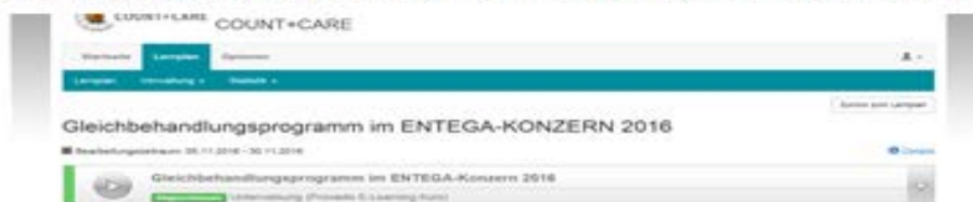
Abb.: Nachweis der Einhaltung des Schulungsintervalls zum Gleichbehandlungsprogramm

2. Die Schulung zur Gleichbehandlung im Jahr 2016 fand vom 05.11.-30.11.2016 statt.